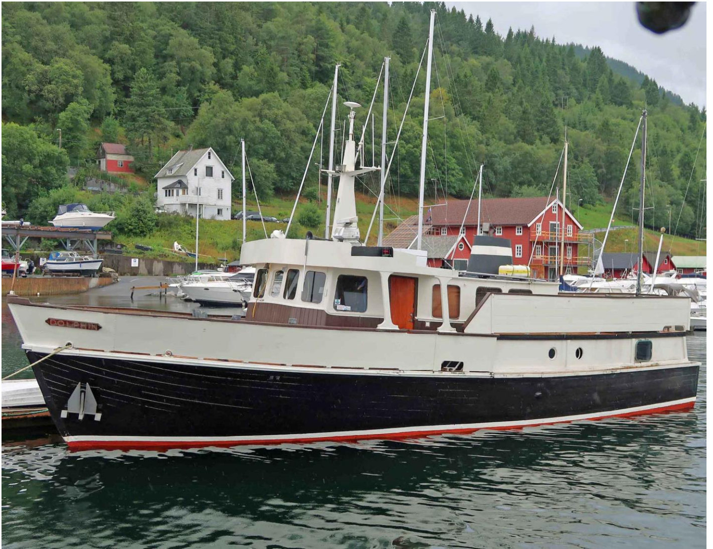
Dolphin i Litlebergen august 2018