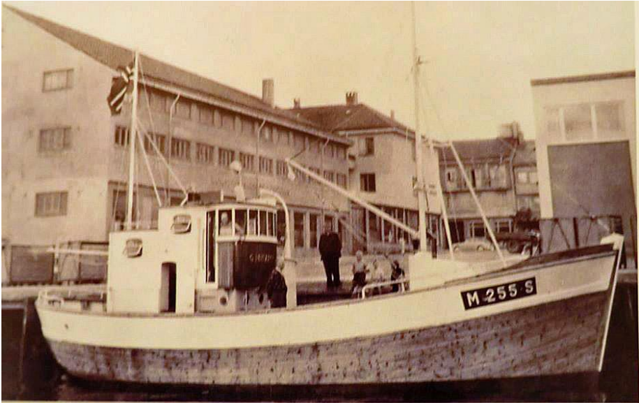
starten og fram til 1969 ble det bygget 15 trebåter av omløst denne typen. Dette er "Gjømann" B. nr. 7. En 50 foting.

et var Kristen Skorgenes som ordnet kontraktene tre slike båter, Solstrand gjorde byggejobben.