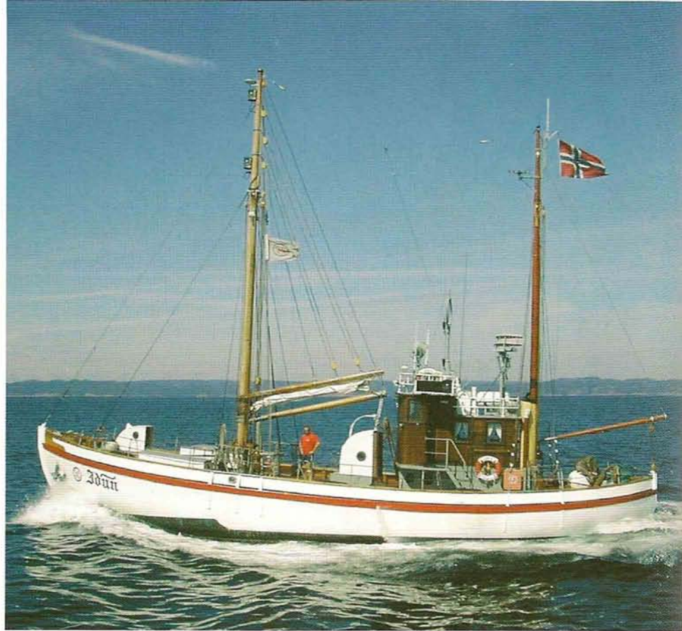
”Idun” passerer Lindesnes 2002.