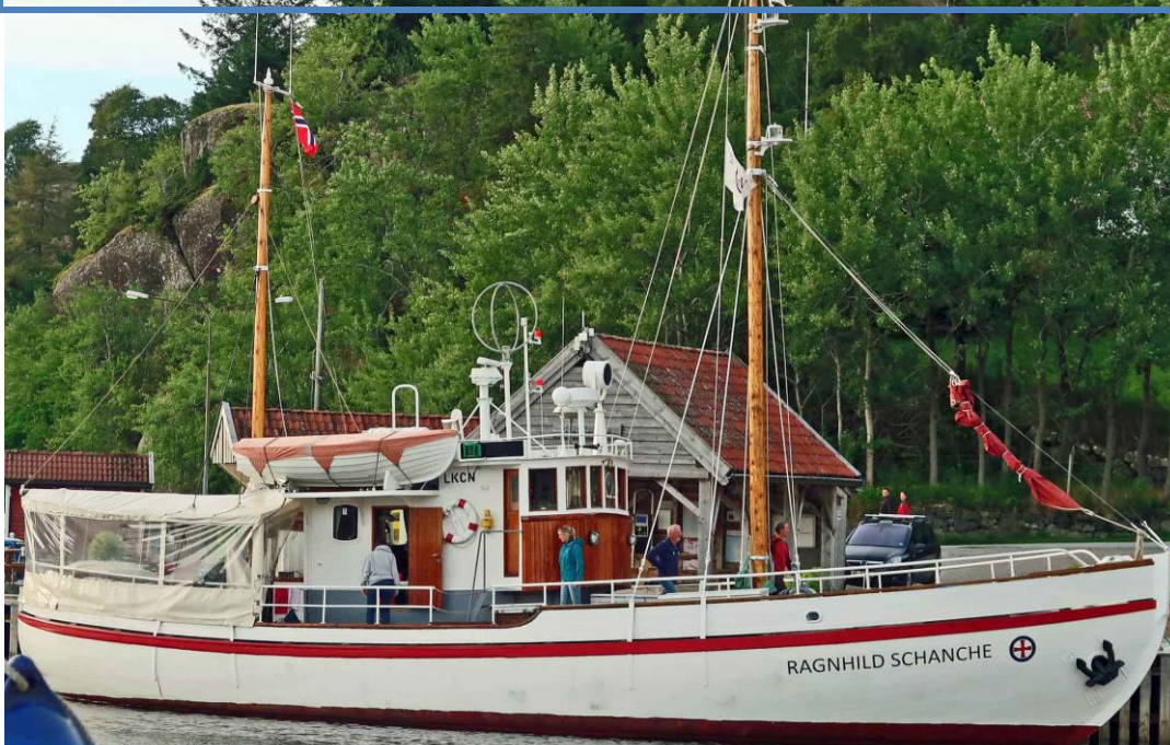
Aiourført 16. mars 2019

Tore Kjøstvedt og Wollert Bjørndal (nåværende eier) har vært eiere av begge disse skøytene.